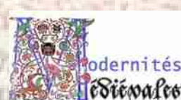
Image de fond : Barthélemy l'Anglais, Le Livre des propriétés des choses , 1480, enluminure d'Evrard d'Espinques, Paris, BnF, département des Manuscrits, Français 9140, fol. 243v.